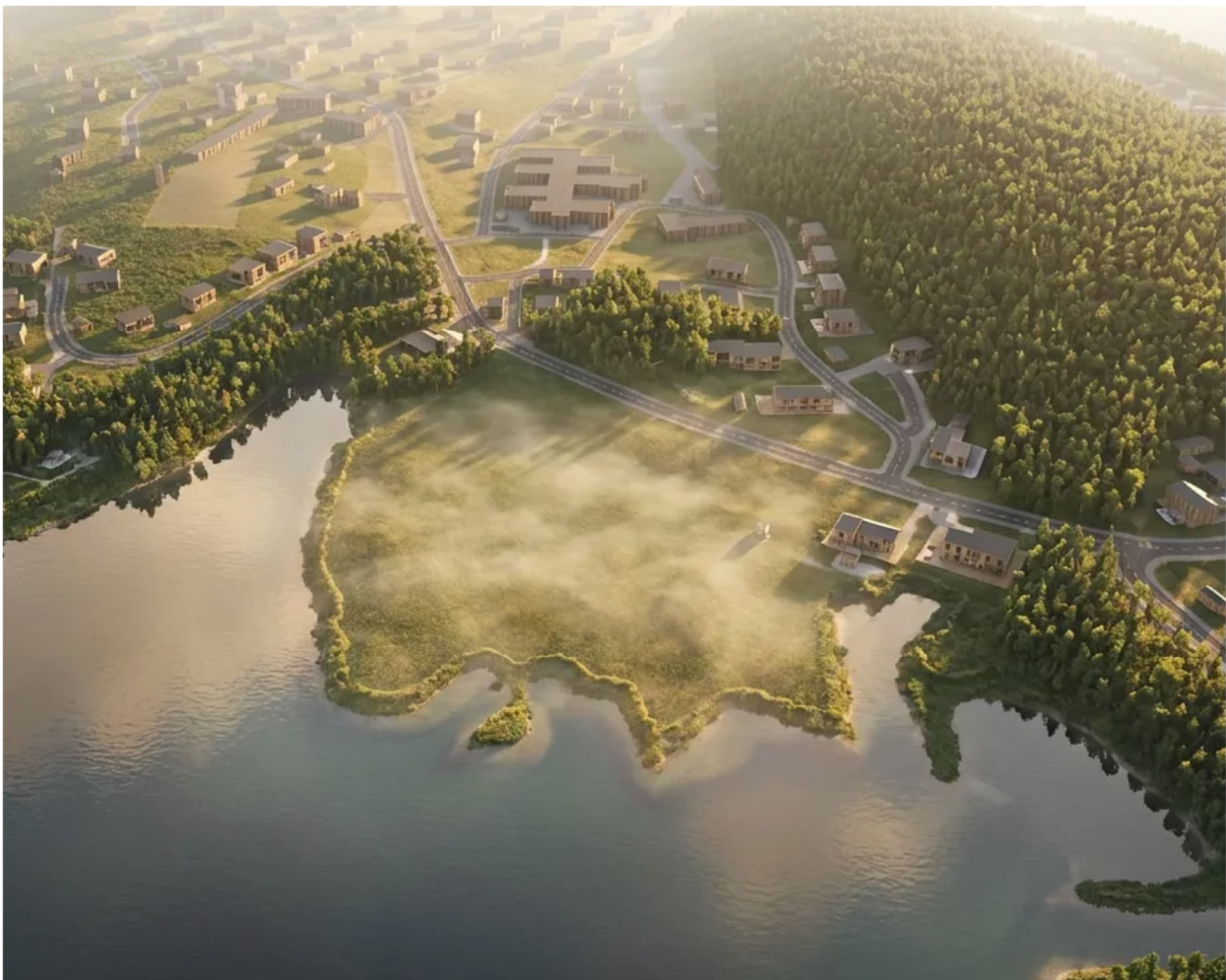
Kuva 1. Ilmakuva suunnittelualueelta. kuvan keskiosassa näkyy Kurkiniityn peltoalue.